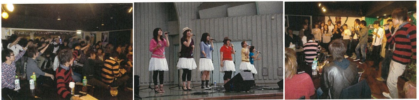
交流ライブの様子