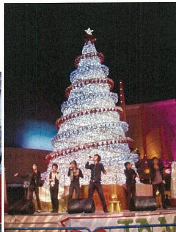
★JAM2009@舞浜イクスピアリ