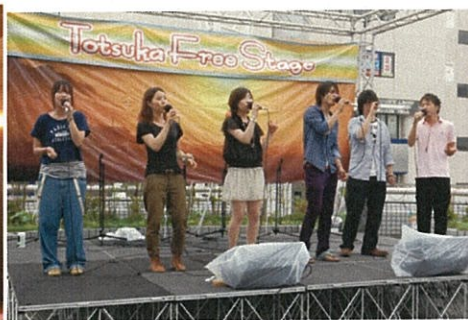
★戸塚駅でのストリートライブ