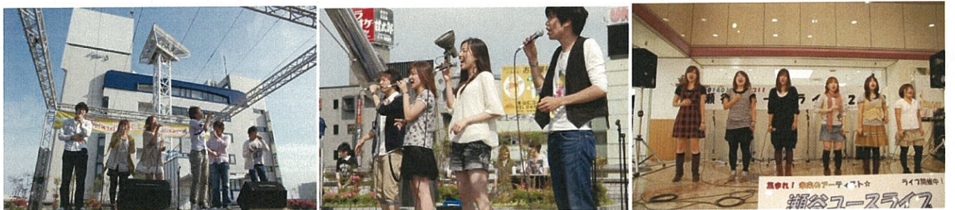
★合同ライブ@戸塚駅