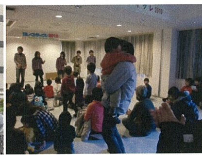
団地での復興ライブ

バンド単位での活動も盛んで、JAM(Japan Acappella Movement)という日本最大級関東アカペライベントに厳しい審査を通過して出演したり、アカペラバトルを行う某テレビ番組に出演したりなど、活動の幅は広いです。