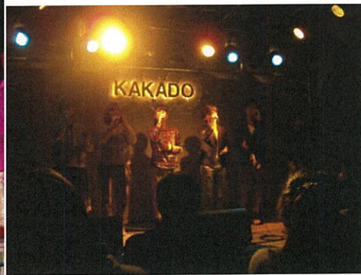
ライブハウスでのライブ