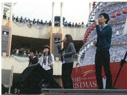
★JAM2010@舞浜イクスピアリ

バンド単位での活動も盛んで、JAM(Japan Acappella Movement)という日本最大級関東アカペライベントに厳しい審査を通過して出演したり、アカペラバトルを行う某テレビ番組に出演したりなど、活動の幅は広いです。