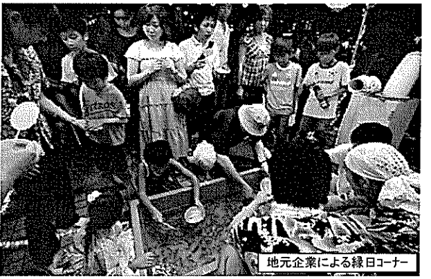
地元企業による緑日コーナー