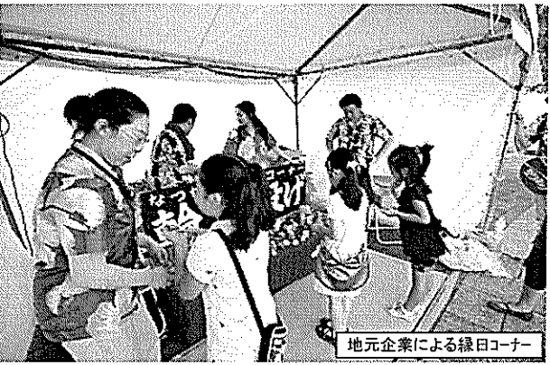
地元企業による緑日コーナー