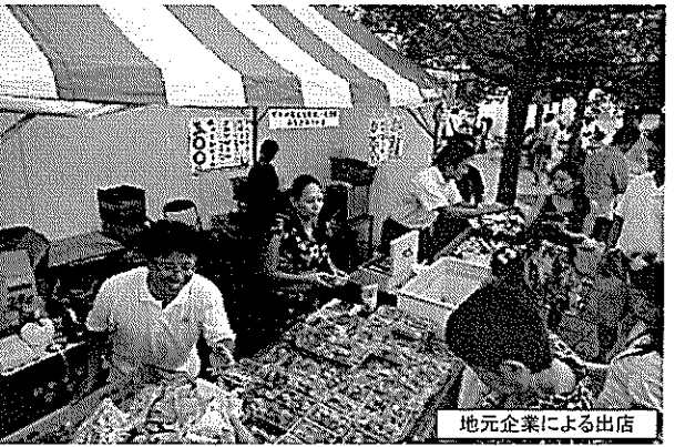
地元企業による出店