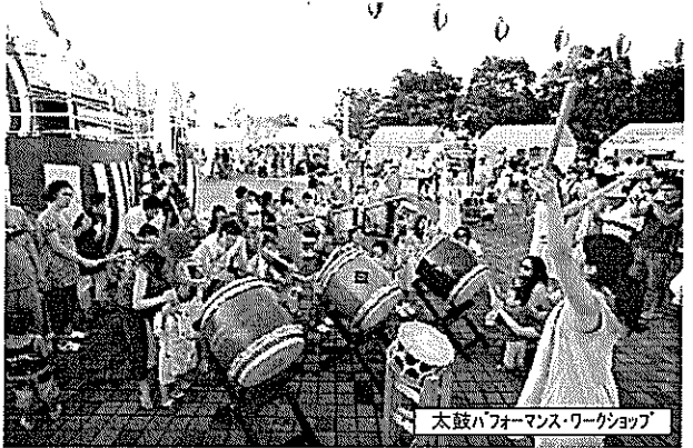
太鼓パフォーマンスワークショップ