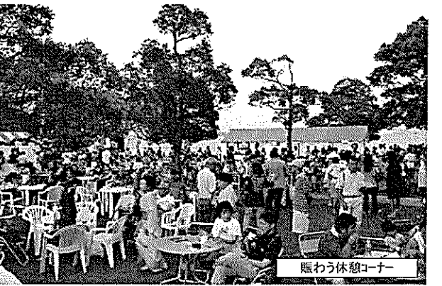
賑わう休憩コーナー