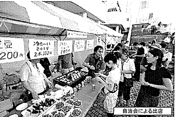
自治会による出店