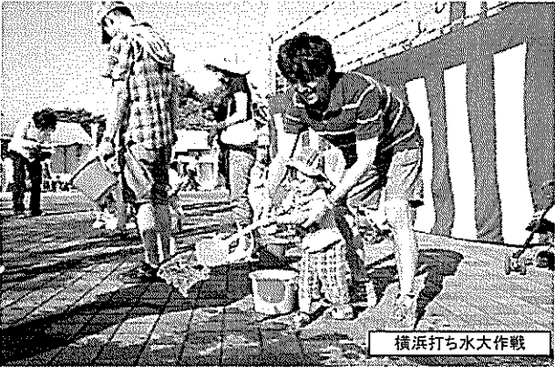
横浜打ち水大作戦