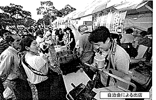
自治会による出店