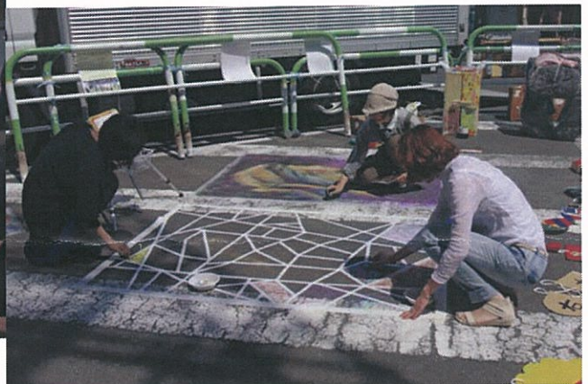
↑隣に枠をつくり埋めてもらう ↓完成