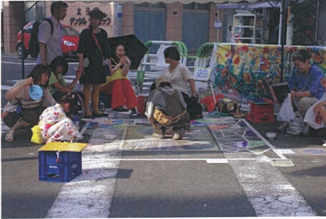
↑額縁を、参加者に埋めてもらう ↓完成