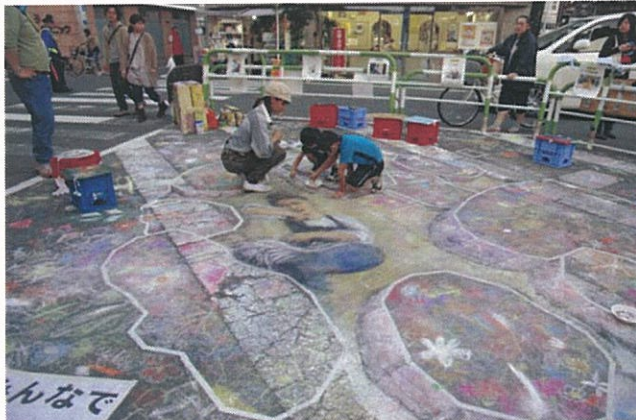
↑3Dの花壇にお花を描いてもらう