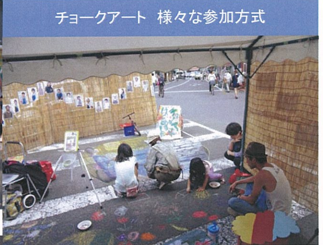
↑周りに思い思いに描く ↓完成