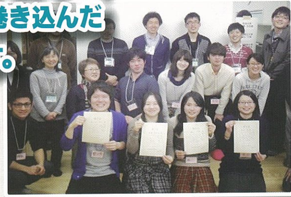
NPO×大学 大学生が市内NPOで活動体験！ 「NPOインターンシップ事業」