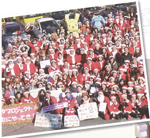
NPO×企業 横浜に笑顔をプレゼント！ 「横浜サンタプロジェクト」