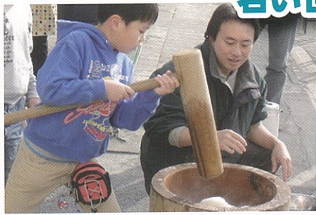
NPO×若者 横浜型プロボノプロジェクト！ 横浜アクションプランナー

企業や大学、NPOといった多セクター、 若い世代から幅広い多世代を巻き込んだ 活動を展開しています。