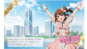
【アイドル別：春日未来】