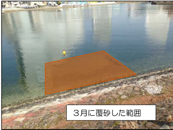
3月に覆砂した範囲