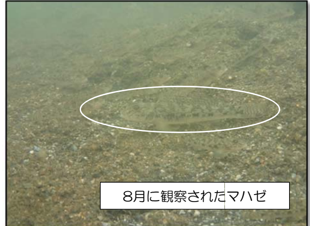
8月に観察されたマハゼ

*1 生物確認種類：ア川属、アサ属、タジマイギンチャク、ムサガイ、アサリ、マガキ、イガニ、クダイ、マハゼほか