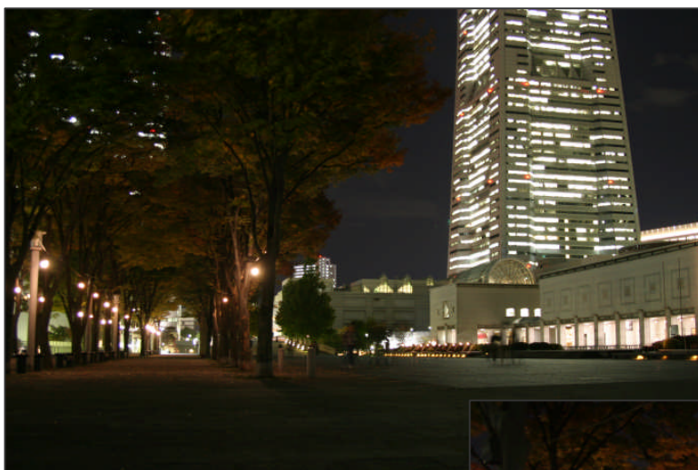
けやき並木に白熱灯を設置（左側）