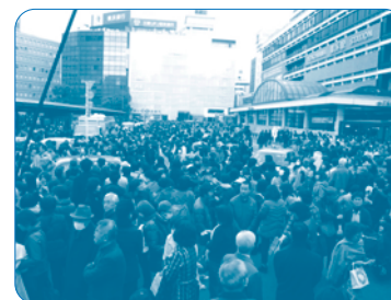
지진 발생 직후 인파로 혼잡한 요코하마역 주변

2011년 동일본대지진 때는 지진 발생 직후에 모든 철도가 운영을 정지해 많은 사람이 귀가가 곤란해졌습니다. 역 주변은 다음날 아침까지 운영 재개를 기다리는 사람으로 넘쳐났으며 각지에서 혼란도 발생했습니다.