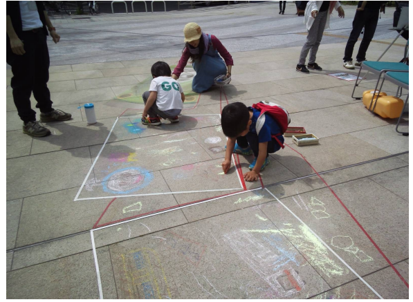
4月29日 5月3日 横浜三井ビルディング