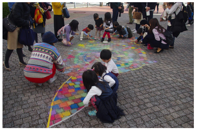
12月22日 23日 ナビオス横浜