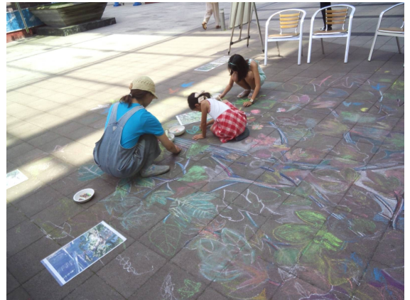
8月6日 8月7日 みなとみらいグランドセントラルタワー（MMテラス）